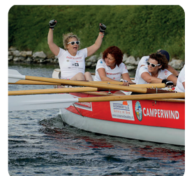
Bijschriften in calibri bold

Lorem Ipsum is slechts een proeftekst uit het drukkerij- en zetterijwezen. Lorem Ipsum is de standaard proeftekst in deze bedrijfstak sinds de 16e eeuw, toen een onbekende drukker een zethaak met letters nam en ze door elkaar husselde om een font-catalogus te maken.